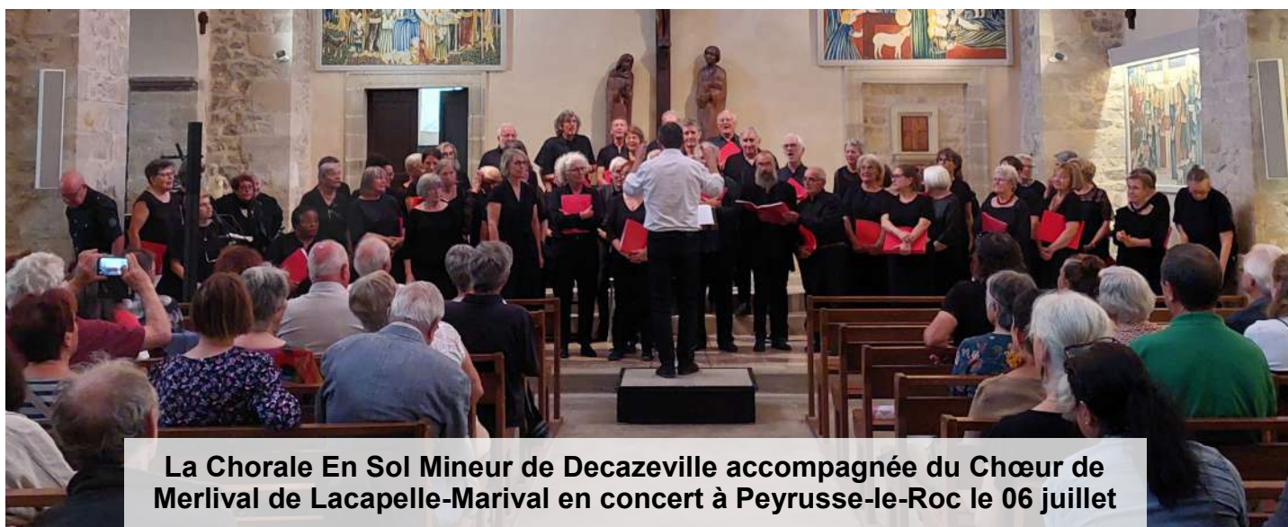
La Chorale En Sol Mineur de Decazeville accompagnée du Chœur de Merlival de Lacapelle-Marival en concert à Peyrusse-le-Roc le 06 juillet