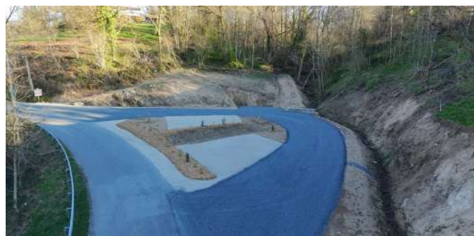
Création d'un parking (route de Naussac)