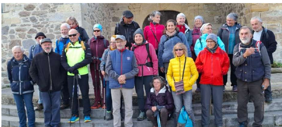
Les étoiles du chemin en randonnée à Peyrusse-le-Roc le 27 septembre

Chaque année, des associations extérieures à la commune choisissent Peyrusse-le-Roc pour y organiser des événements et compléter un calendrier culturel pétrucien déjà bien rempli !